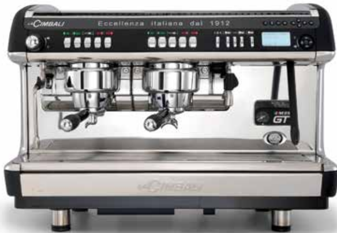
M39 GT UP DT/2