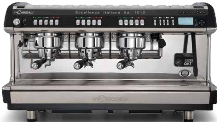
M39 GT UP DT/3